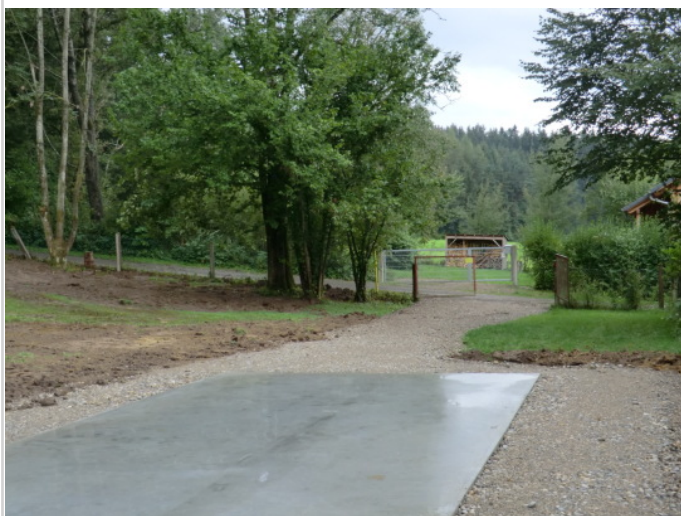
Blick zur unteren Zufahrt