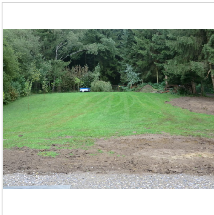
Blick von unten