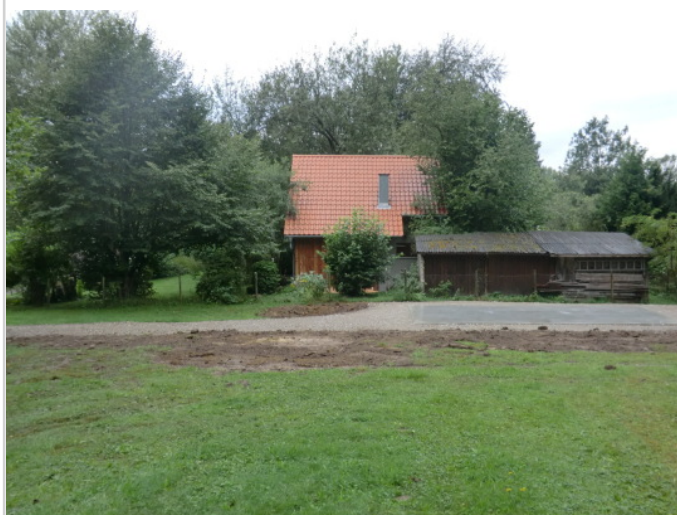
Blick zum nächsten Nachbarn