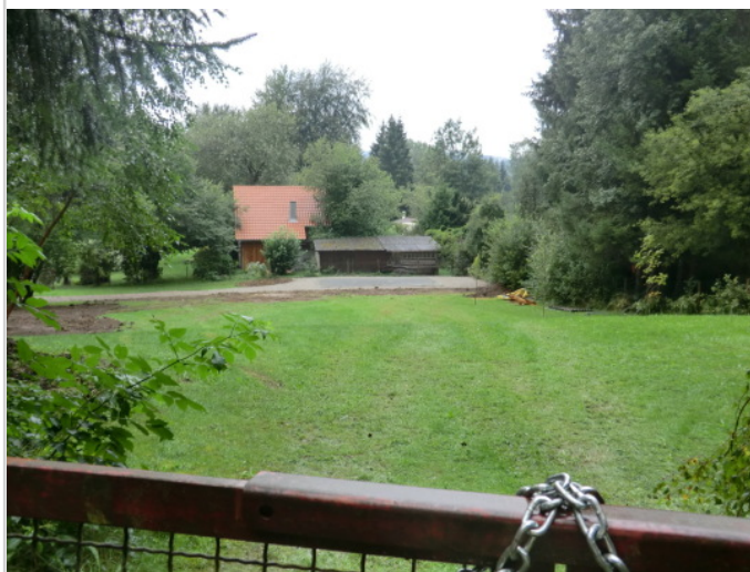
Blick von oberer Zufahrt