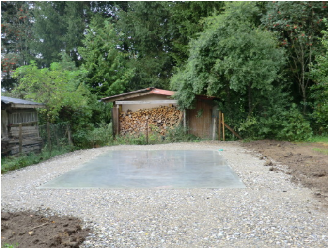
neue Bodenplatte Gerätehaus